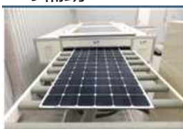
<太陽光発電設備リサイクル設備>